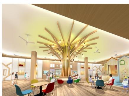
キッズスペースとオープンカフェのあるセンターコート