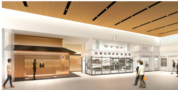
和の設えでおもてなしするラウンジと三重トヨタ自動車の歴史を伝えるコーナー